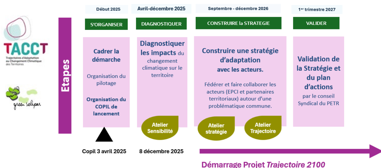
Figure 1 : Calendrier de la démarche TACCT

L'ensemble de la démarche repose sur une forte dynamique de co-construction, favorisant l'appropriation collective, la sensibilisation et la mobilisation des acteurs du territoire face aux enjeux de l'adaptation climatique.