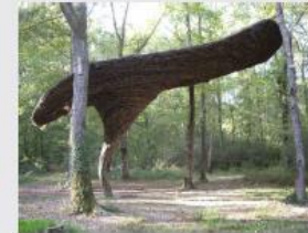
Kazé à Saint-Elix d'Astarac, au bois de Larrouy