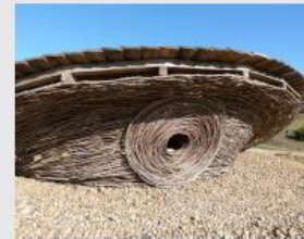
Yané à Villefranche d'Astarac