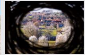
Yané à Villefranche d'Astarac