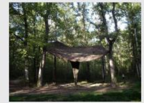
Kazé à Saint-Elix d'Astarac,