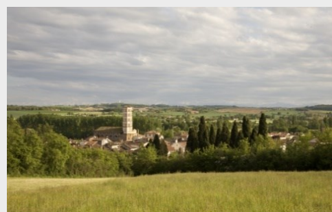
Lombez, vue depuis Saint Majan