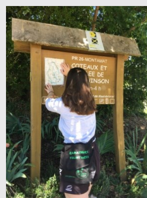
Départ randonnée PR 26 de Montamat