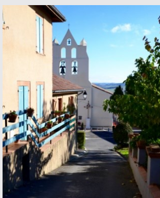
Eglise Saint-Amat de Sauveterre.