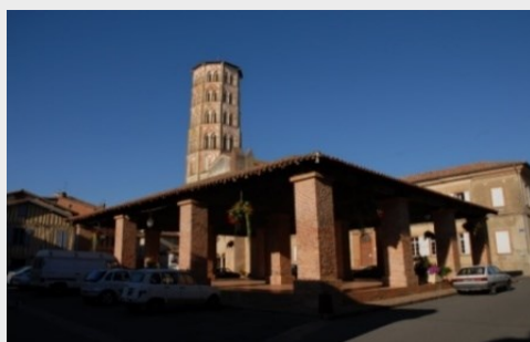
Lombez centre historique, cathédrale Sainte Marie