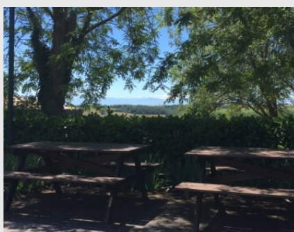
Tables de pique-nique avec vue sur les Pyrénées

Tél : + 33 (0)5 62 62 55 40 contact@tourisme-saves.com www.tourisme-saves.com