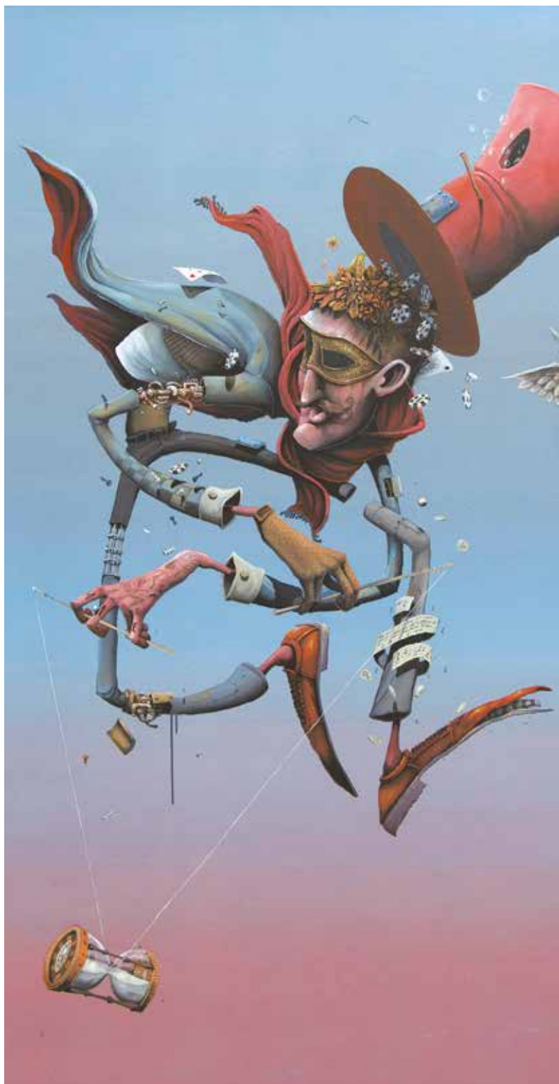
Toile "Plus le temps de jouer", Maye, 2016

https://www.facebook.com/victorien.liria