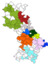
ZAE de Mailloles