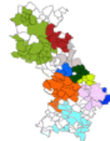
ZAE du Plateau de Lis