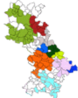
ZAE Au Roulege (Pujaudren)